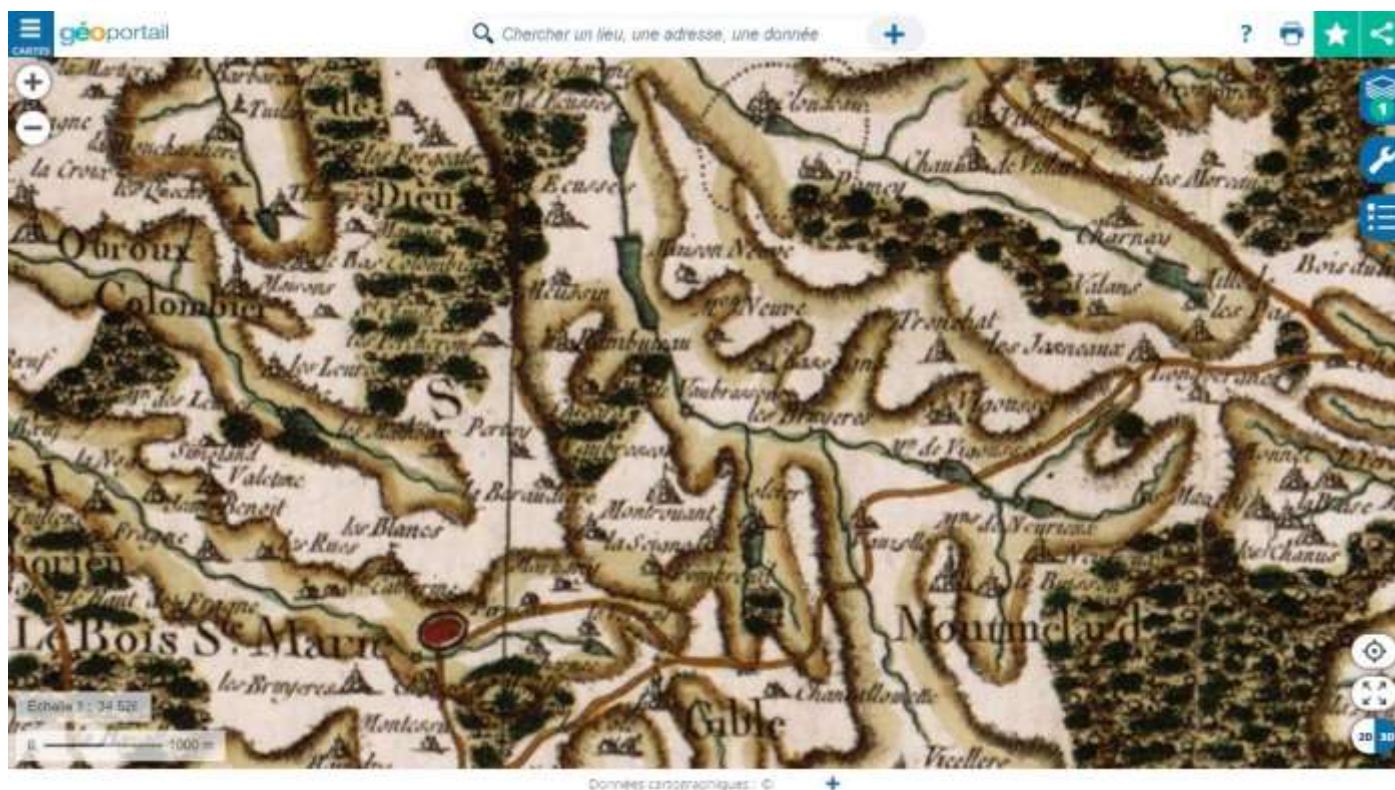
Carte de Cassini de la région de Gibles