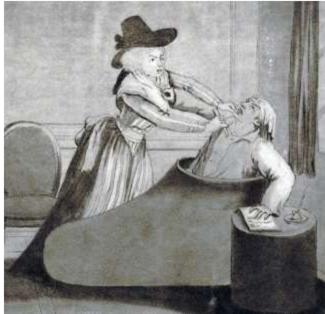
Assassinat de Marat dans sa baignoire