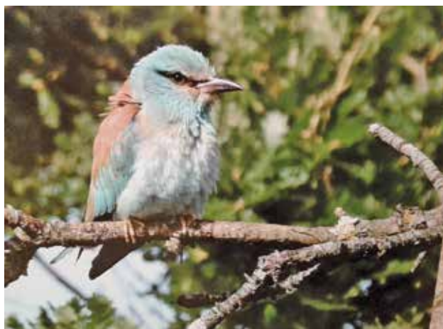
Le verdier-martin pêcheur cherchant un Sosa dans son arbre