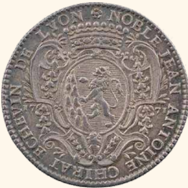
Armes : d'azur à un lion rampant contre un chirat (ou montagne) de pierres d'argent.