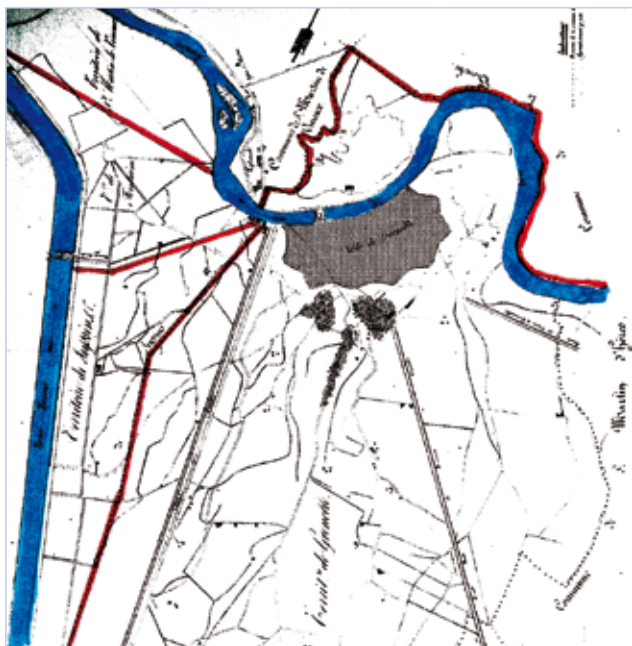
Limites territoriales jusqu'en 1862

Cependant, le tracé final du Drac sera bien « imposé et implanté » sur le territoire des communautés voisines de Grenoble, comme représenté sur le plan ci-dessus.