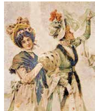
Demoiselles vers 1750