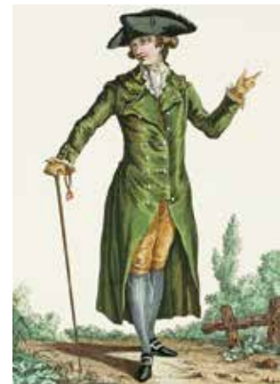
Redingote de voyage vers 1750