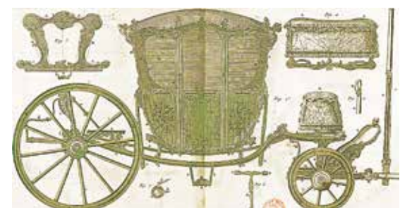
Berline en vis-à-vis à deux fonds - Bibliothèque Mazarine