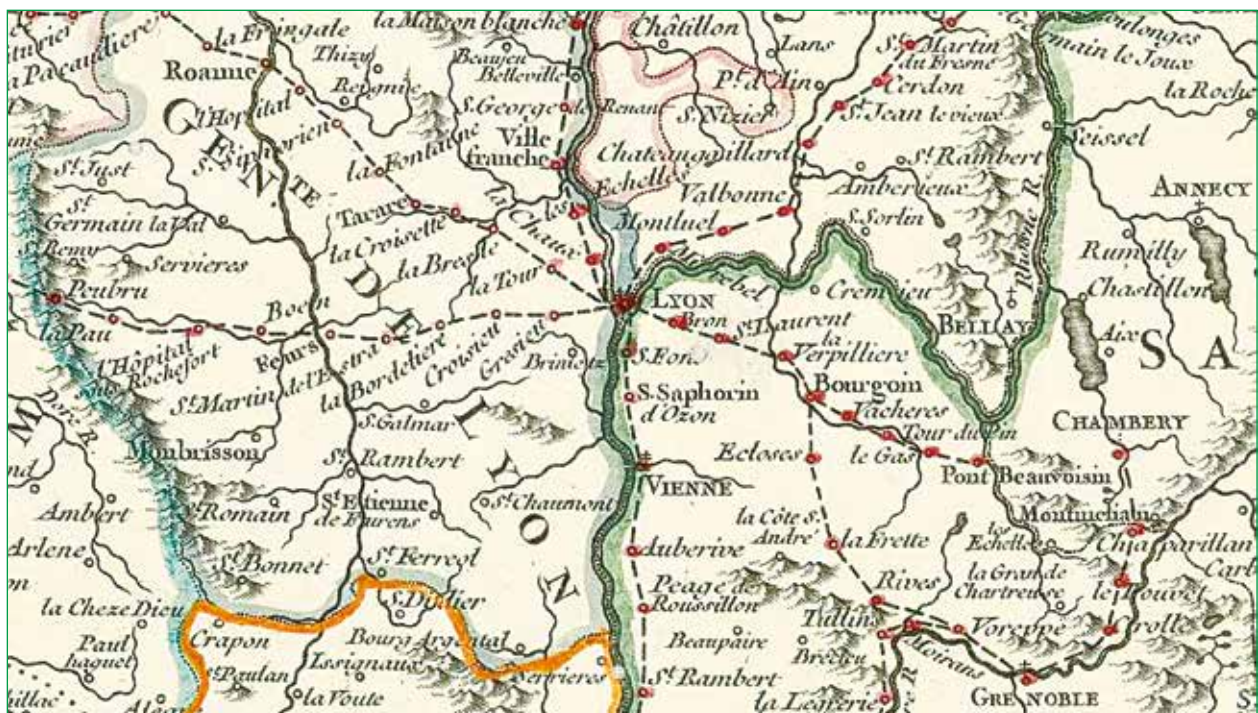
Carte des postes au départ de Lyon en 1751