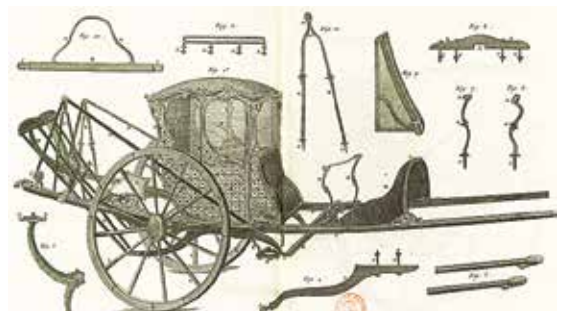
Chaise de poste à l'écrevisse - Bibliothèque Mazarine