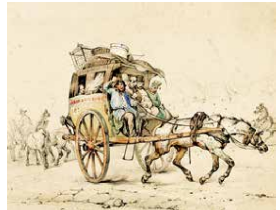
La vie laborieuse d'un cheval