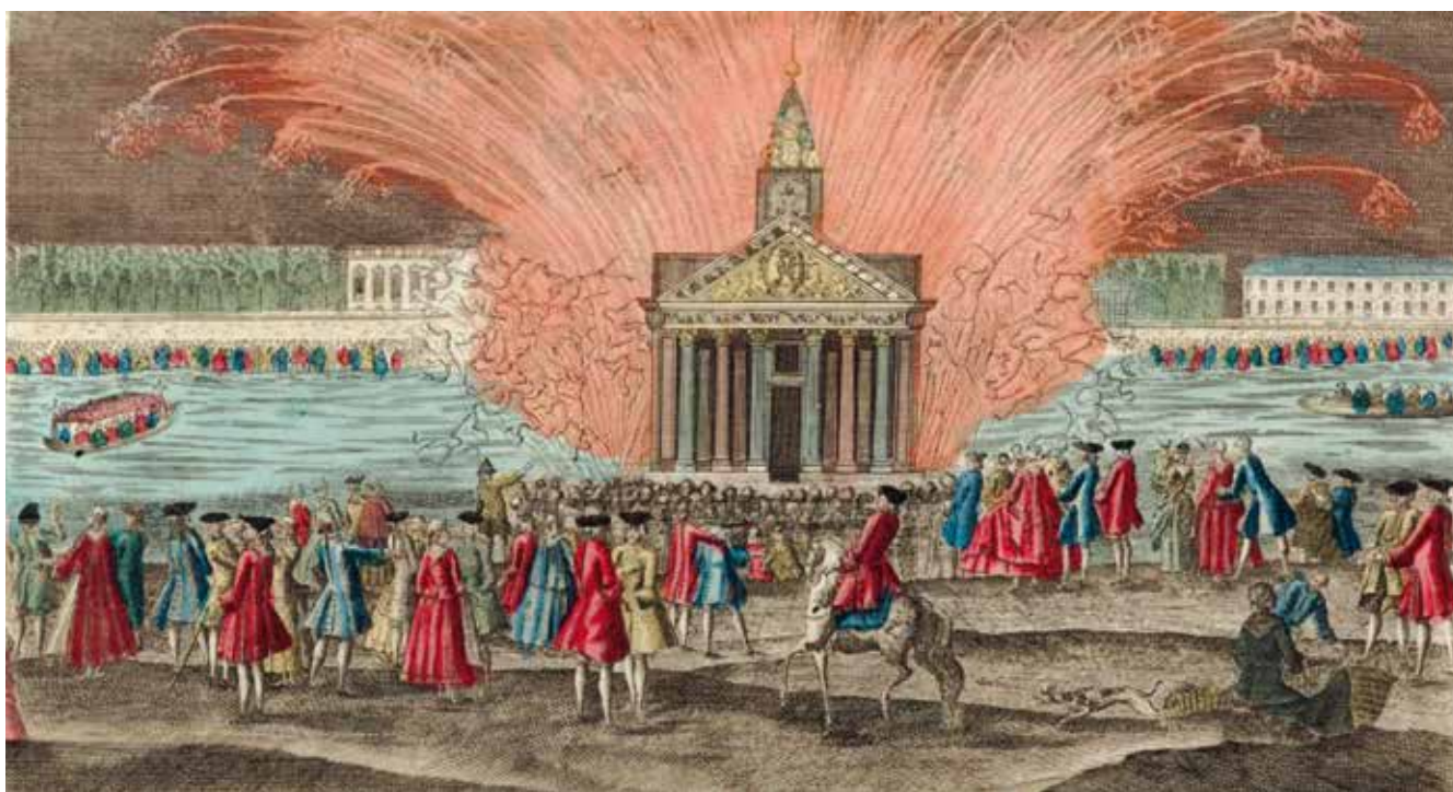
Feu d'artifice tiré à la place de Louis XV le 30 mai 1770, à l'occasion du mariage de Louis Auguste Dauphin de France avec l'archiduchesse Marie Antoinette, sœur de l'empereur.

Le nombre de 600 morts et blessés est exagéré. La Gazette de France du 4 juin 1770 relate l'événement survenu le 30 mai : Les plaisirs de cette fête ont été troublés par un malheur qu'on ne pouvoit ni prévenir ni prévoir. La rue par laquelle le peuple se porta avec le plus d'affluence, après le feu d'artifice s'étant trouvée embarrassée par différens obstacles, & la foule étant prodigieuse, un grand nombre de personnes de tout sexe & de tout âge ont été étouffées. Le nombre des morts monte à cent trente-deux, sçavoir, quarante-neuf hommes ou garçons & quatre-vingt trois femmes ou filles, celui des blessés est de vingt-six : ces derniers ont été portés à l'Hôtel-Dieu & à la Charité ; et la plupart sont actuellement hors de danger.