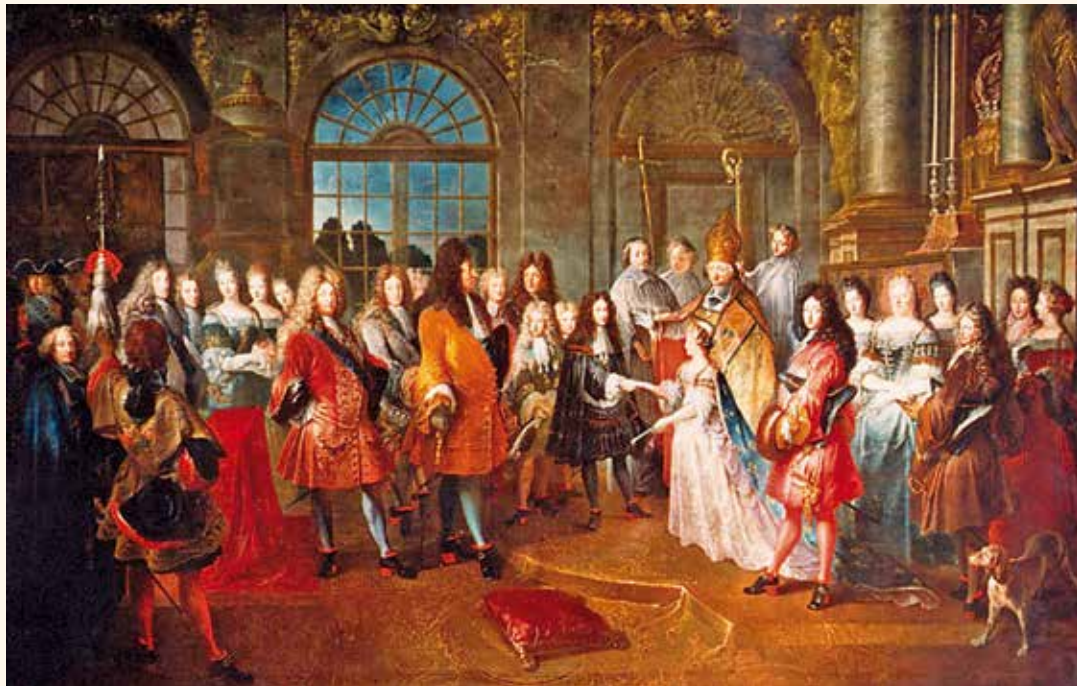
Mariage du duc et de la duchesse de Bourgogne à Versailles - tableau d'Antoine Dieu (1692-1727)