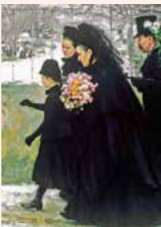
Émile Friant (1863-1932)

[1780-1784] Il y a eu dans cette paroisse, ces cinq dernières années 351 baptêmes, dont 189 garçons et 162 filles, ce qui donne par année commune 70 baptêmes et 1/5. Il y a eu 51 mariages qui donnent par année commune 10 et 1/5. Il est mort 289 personnes, ce qui fait 57 et 4/5 par an. Elles avaient vécu 7 367 ans 6 mois qui, divisés entre 289 personnes, donnent pour la vie commune à chacune d'elles 25 ans 5 mois 28 jours 58/289 de jour.