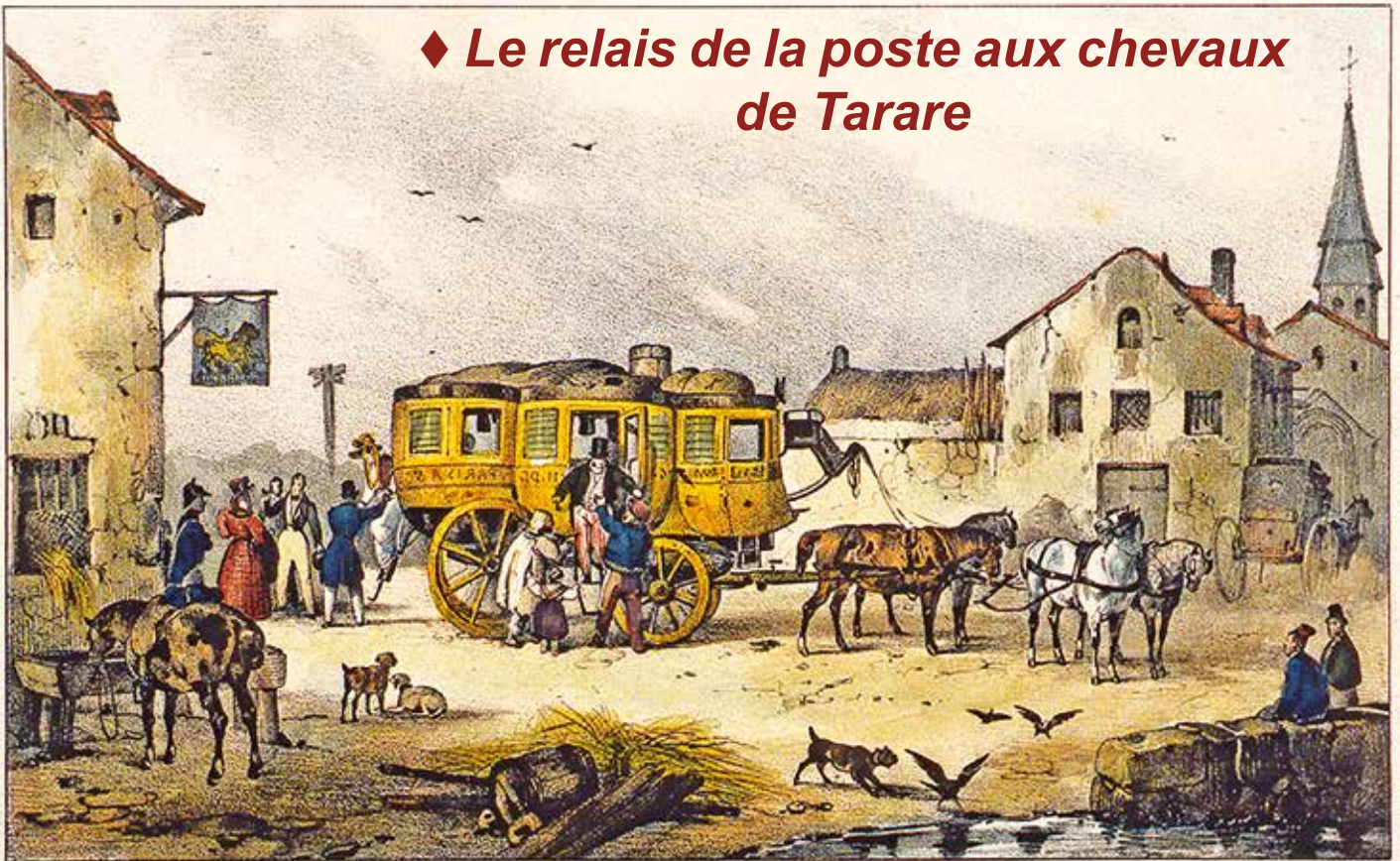
VOITURE POUR LES ENVIRONS DE PARIS .