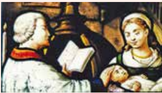
N.D. des Fleurs - Villembrey (Oise)

Un siècle et demi avant la création de l'INSEE, le curé de Neuville-sur-Saône calcule année après année le nombre de baptêmes, mariages et enterrements survenus dans sa paroisse. Il regroupe ensuite les données par tranche de cinq ou dix ans sous forme de tableaux, puis établit les statistiques sur la natalité, nuptialité et mortalité. Les statistiques et la démographie n'en sont encore qu'à leurs balbutiements. Jean Claude Achille Guillard (Marcigny 28.09.1799 - Paris (18 e ) 20.02.1876) inventera le terme « démographie » dans son ouvrage Éléments de statistique humaine, ou Démographie comparée paru en 1855.