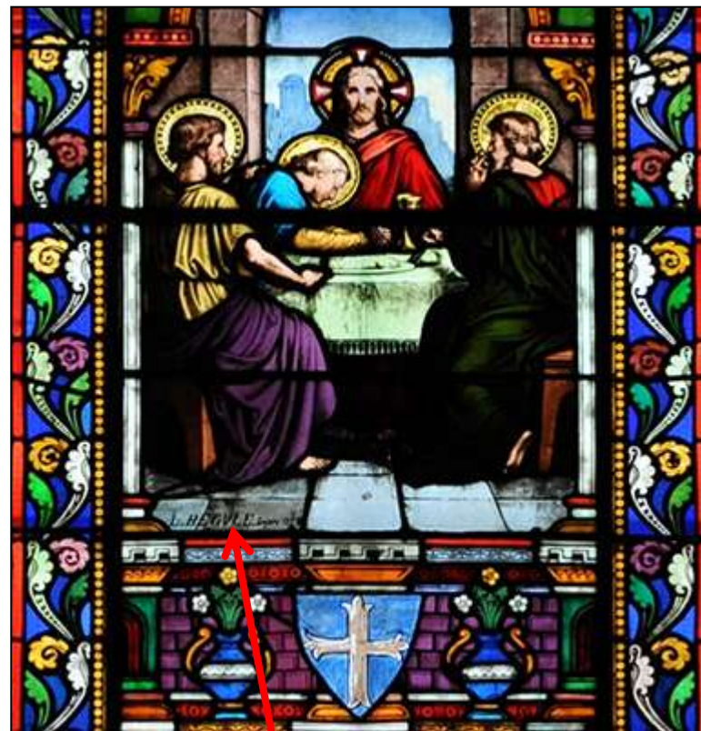
Signature "L. BEGVLE"