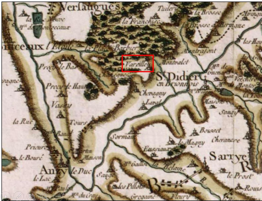
Varelle, hameau alternatif de Saint-Didier-en-Brionnais et Anzy-le-Duc sur la carte de Cassini